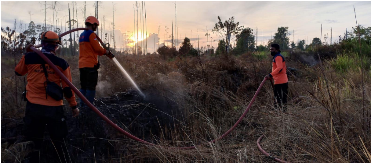
Dokumentasi Penanganan KARHUTLA di Kab. Bulungan