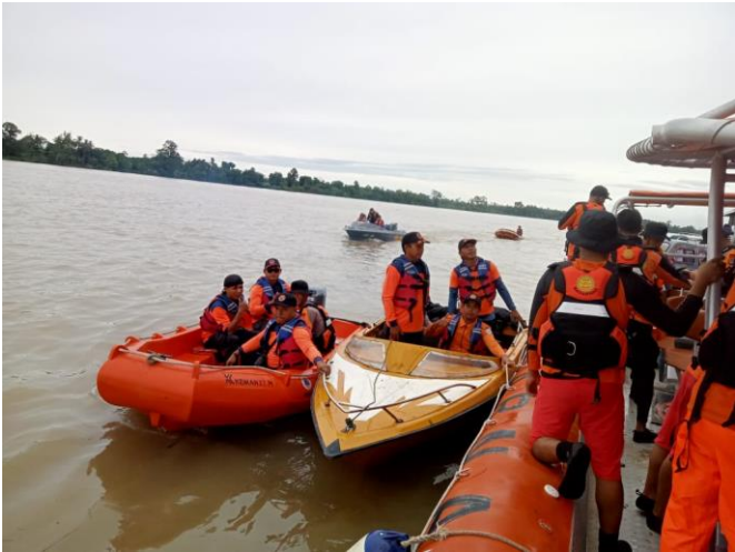
Dokumentasi Pencarian Korban Hilang Hari 1 kejadian Laka Transportasi ( sungai )