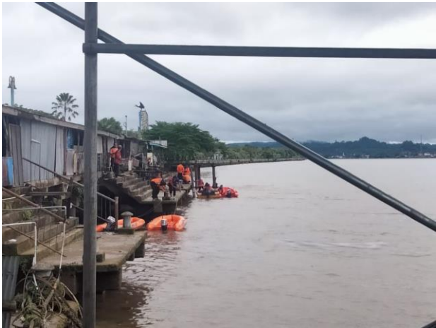
Pecarian hari ke 2