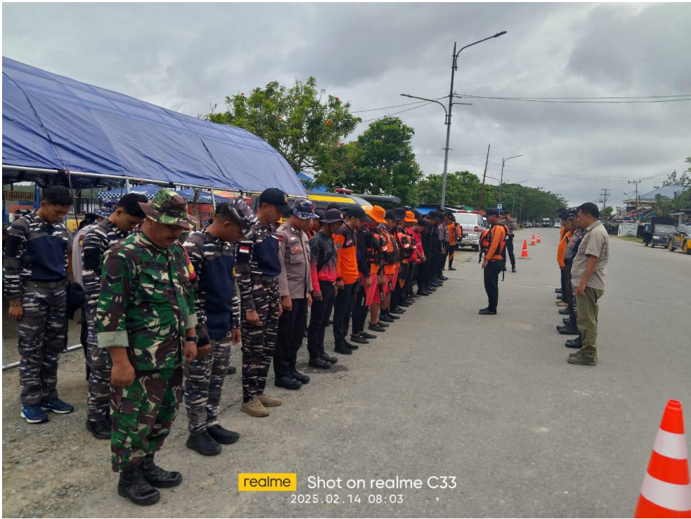
Dokumentasi Pencarian Korban Hilang Hari 4 kejadian Laka Transportasi ( sungai )